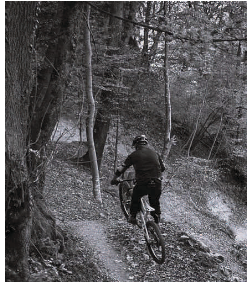
Biketrail Üetliberg

Und insbesondere die Siedlungsgebiete am Fuss des Üetlibergs sind durch die Hitzeentwicklung angewiesen auf die Kühlfunktion „Wald“. Diese ist aber nur durch ausreichend